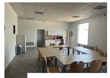
la salle de réunion