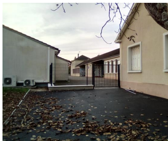
Accès cour de l'école