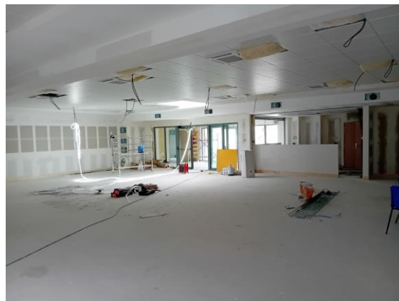
l'entrée et l'espace bar