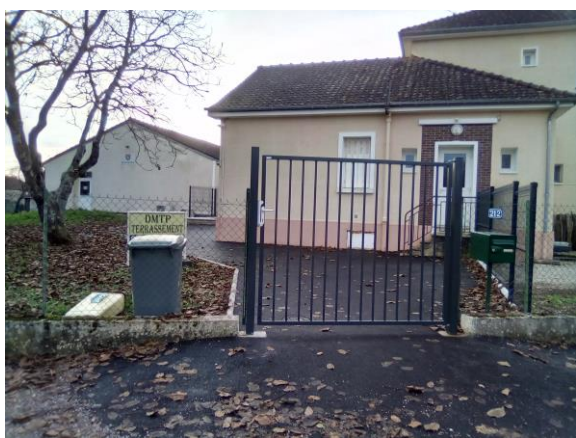
Accès école, garderie, bibliothèque

Les gendarmes seront attentifs à la bonne circulation dans ce secteur.